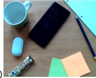
2 eksempler (bookbento og mine ting)